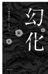
2019.10 南京大学出版社 《梅》崎春生 《幻化》

小说集《幻化》收入日本第一次战后派文学家梅崎春生的三部代表作——《樱岛》《日落处》《幻化》。中篇小说《樱岛》讲述二战结束前夕,海军通信兵中村兵曹曹调离坊津