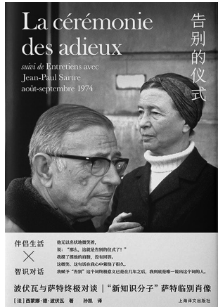
《告别的仪式》 [法]西蒙娜·德·波伏瓦 上海译文出版社 2019.10

议:将两人的谈话用录音记录下来,整理成文,再加上波伏瓦的日记、友人的笔录和口述,最后形成了一部完整的作品。