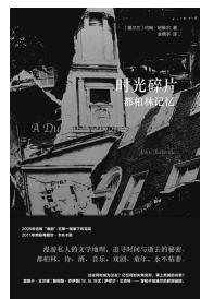
2019.11 南京大学出版社 《约》班维尔 《时光碎片:都柏林记忆》

该书从公元前6000年开始讲起,直到20世纪,前后贯穿近八千年,将拜占庭、君士坦丁堡和伊斯坦布尔的故事融会贯通,写于一书,以平易生动的叙事、翔实严谨的实地考察和优美的笔调,探索这座“世界之都”如何在长达数千年的历史光阴中成为世界文明的中心,探究它如何在天主教、东正教、伊斯兰教的交融影响下,形成自己独具一格