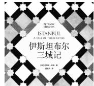
2019.10 上海三联书店 《英》贝塔妮·休斯 《伊斯坦布尔三城记》

该书从公元前6000年开始讲起,直到20世纪,前后贯穿近八千年,将拜占庭、君士坦丁堡和伊斯坦布尔的故事融会贯通,写于一书,以平易生动的叙事、翔实严谨的实地考察和优美的笔调,探索这座“世界之都”如何在长达数千年的历史光阴中成为世界文明的中心,探究它如何在天主教、东正教、伊斯兰教的交融影响下,形成自己独具一格