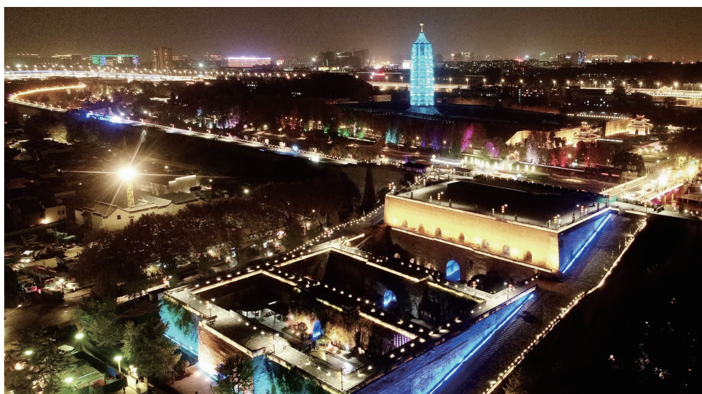
三处地标披上了蓝色的灯光

当晚7:00-8:00，南京的中华门瓮城、大报恩寺遗址公园、老门东历史文化街区三处南京地标亮起蓝色灯光1小时，开启了城墙光影秀。以此为契机，唤起全社会进一步关注和保护儿