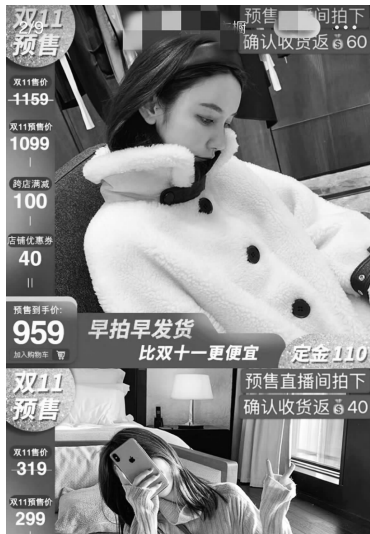
张大奕女装店的预售优惠说明 微博截图

张大奕女装店的官方微博显示,双十一期间,店内23款衣服和1款手表参与返现活动,返现金额10元至800元不等。