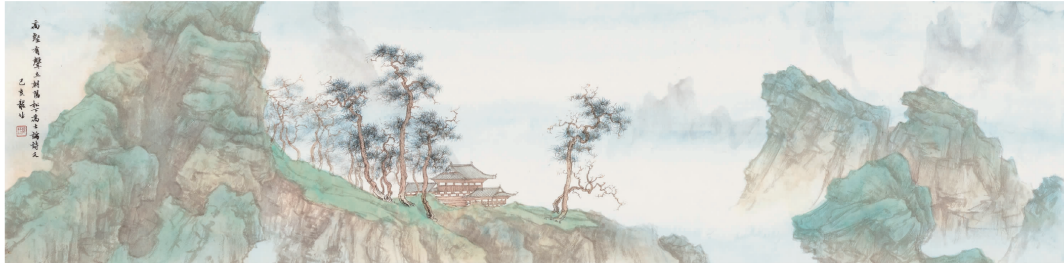
《高壑有声立朝阳》35cm x 140cm

龙珏在艺术格调与方向的追求是明确的,虽然他还在探索的路上,他已深谙中国艺术由熟而后生之理,取法上乘,不断打磨和修炼自己的表达方式,品正而格高。来时一旦归乎性情,其作品将更值得期待!