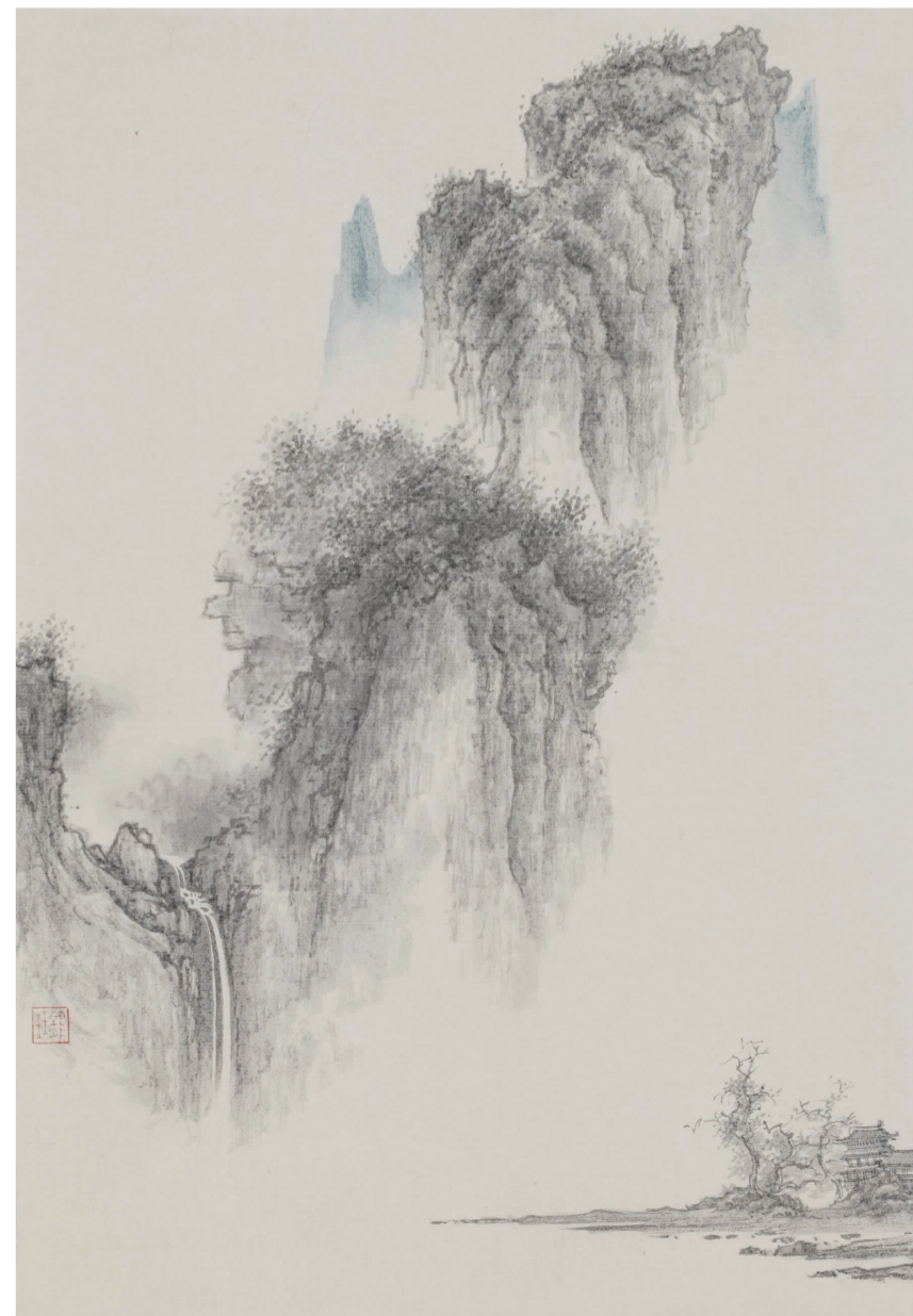
《秋浦》39cm x 26cm