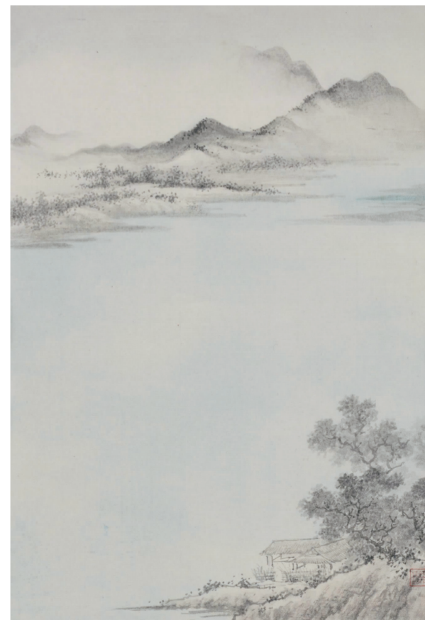
《临江》39cm x 26cm