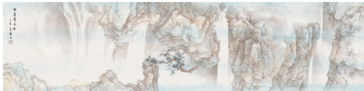
《阴崖叠见图》35cm x 140cm