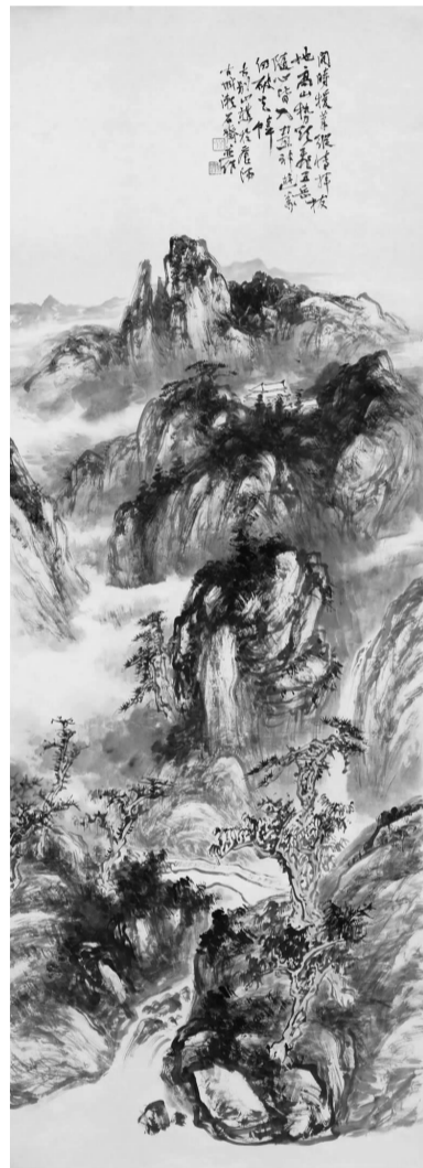
吴德铭《五岳随心皆入画》

展览时间:2019年10月19日—10月28日 展览地点:更斯艺术馆(南京市鼓楼区热河路50号阅江广场办公区6楼)