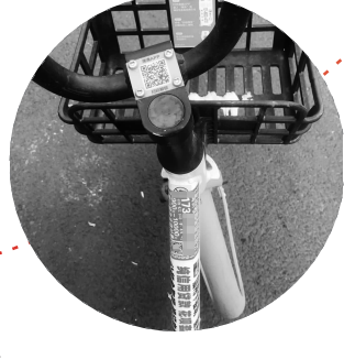
共享单车上的小广告