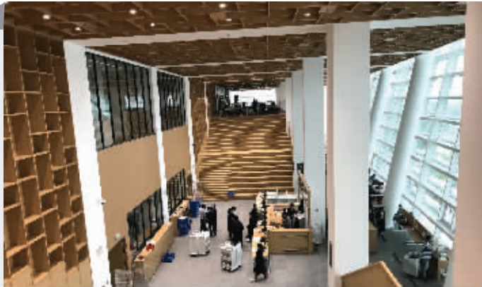
特意设计的大台阶也是阅读场所