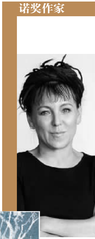
奥尔加·托卡尔丘克