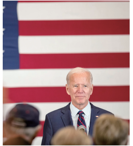
9日,拜登在一场竞选活动中

总统律师西波隆日前致信众议院议长佩洛西等国会民主党人,众议院启动针对特朗普的弹劾调查受党派政治驱使,缺乏法律依据、违背正当程序。他特别指出,佩洛西在