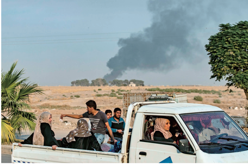
叙利亚平民从战区逃离

土耳其军队9日越境进入叙利亚东北部,针对叙利亚库尔德武装发起行动。轮番空袭和炮击过后,土军特种部队和装甲车兵分4路投入库尔德武装控制区。