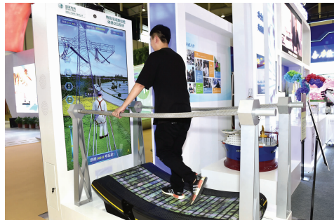
特高压线路巡检体感交互系统