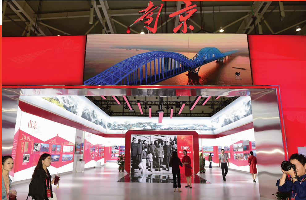
江苏省庆祝中华人民共和国成立70周年成就展今起在南京国际博览中心展出