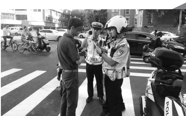
交警早高峰期间查处酒驾、醉驾