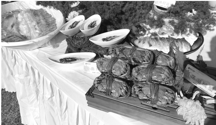
昨天,金坛农民丰收节暨长荡湖开捕节开幕