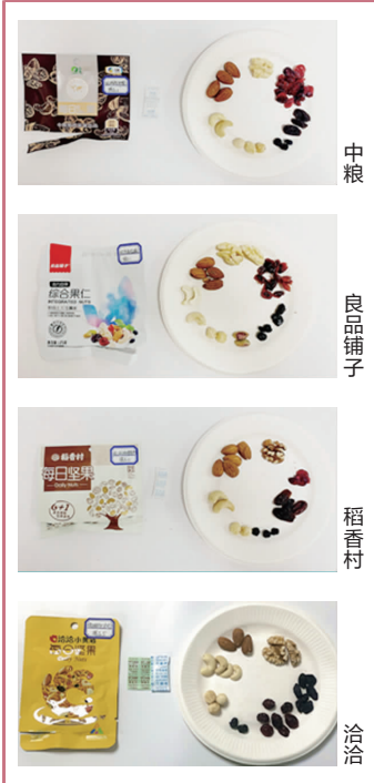
各大品牌的品相