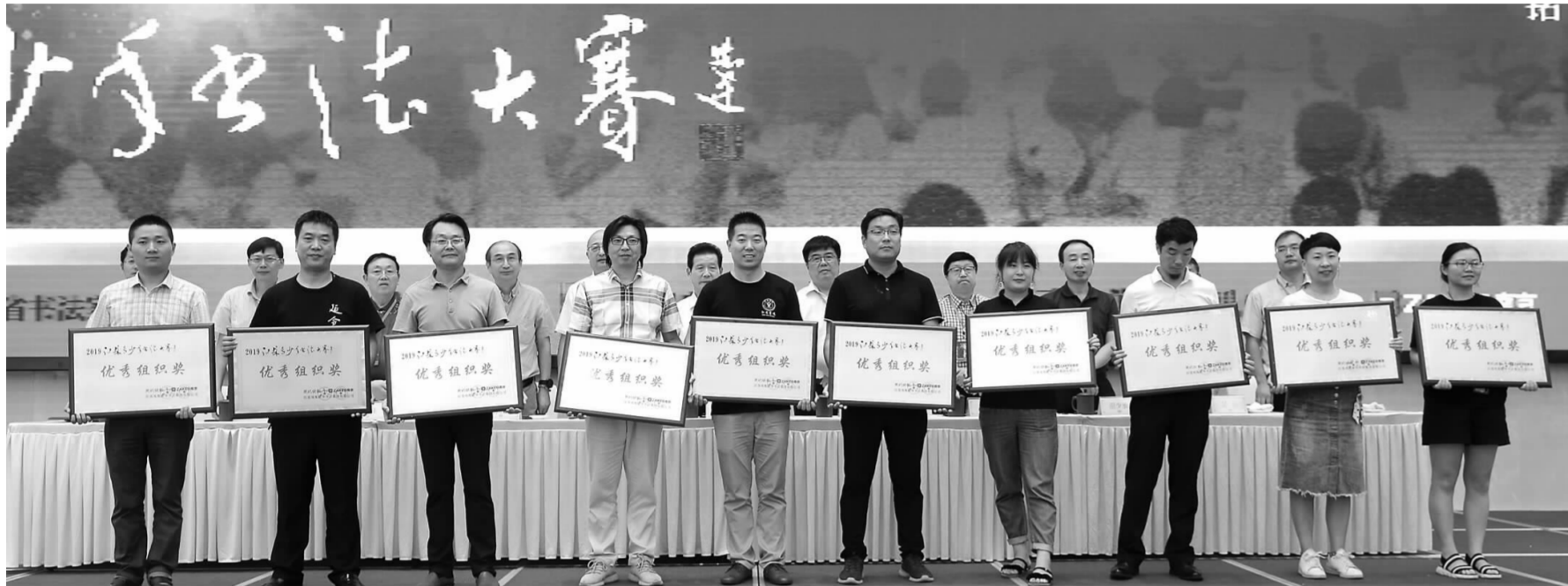
2019江苏青少年书法大赛优秀组织奖颁奖现场

由江苏凤凰出版传媒集团主办、现代快报+·ZAKER南京联合江苏凤凰新华书店集团有限公司共同承办的2019江苏青少年书法大赛于2019年8月9日在常州圆满落幕。千余名书法小高手在总决赛现场各展书技,拼搏最后的胜利。许多小选手在本次大赛中取得优异成绩,得到大赛专家评审团的高度称赞。这其中,不少获奖选手都是经过专业培训,在比赛中发挥出色。本次大赛中有十余家培训机构、学校获得了优秀组织奖和优秀指导老师奖。训练有素对参赛选手来说优势明显,本期《艺加周刊》将带大家认识这些在比赛中获奖的省内优秀培训单位,看看他们都是如何培养出优秀的小书法家的。