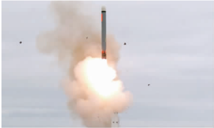
美军18日试射一枚常规弹头陆基机动巡航导弹,飞行超过500公里