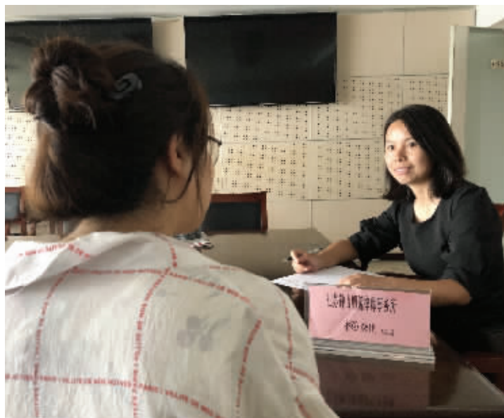
市民来咨询现场(图片与案例无关)