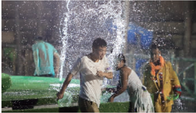
开幕式上的泼水活动

宝华山拥有得天独厚的生态资源，其中，森林覆盖率超过92%，空气中的负氧离子含量高达每立方厘米2万以上。