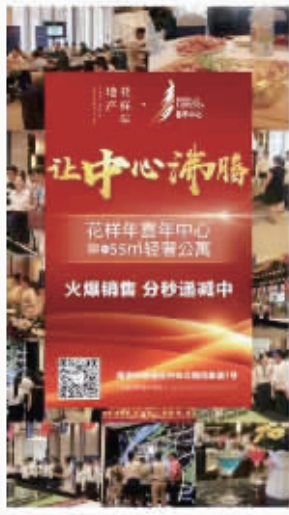
开发商宣传时声称是公寓