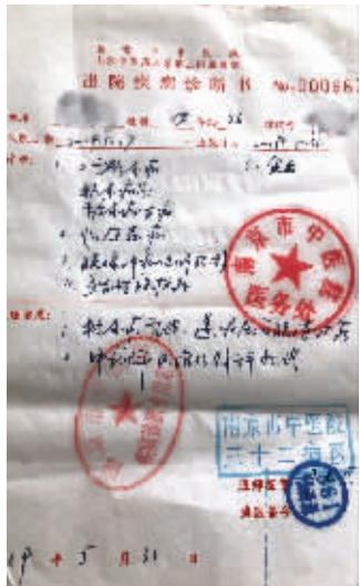
医院出具的出院疾病诊断书