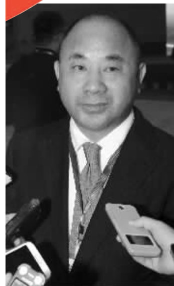
“世界铜王”王文银(资料照片)

此外,平安证券深圳深南东路罗湖商务中心营业部、中信证券北京远大路营业部、华泰证券杭州求是路营业部等,都参与了九鼎新材的炒作。