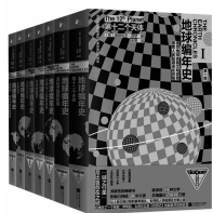
2019年7月 江苏凤凰文艺出版社 撒迦利亚·西琴 《地球编年史》

《地球编年史》全七册,分别为第一部《第十二个天体》,第二部《通往天国的阶梯》,第三部《众神与人类的战争》,第四部《失落的国度》,第五部《当时间开始》,第六部《宇宙密码》,第七部《完结日:审判与回归的预言》。