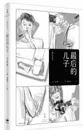
2019年7月 上海人民出版社 世纪文景 吉田修一著 《最后的儿子》

作者撒迦利亚·西琴,著名的国际畅销书作家,近东古文明研究领域专家,世界上少数能解读苏美尔楔形文字的学者,精通希伯来语、塞姆语和欧洲各种语言。1920年7月11日出生于阿塞拜疆巴库,在乌克兰和巴勒斯坦度过幼年和少年时代;成年后在伦敦大学攻读过考古学、历史学、语言学、经济学及神话学等;从1976年起,他陆续出版了《地球编年史》系列作品,引起巨大反响。2010年10月9日病逝于美国纽约。他的研究范围涵盖了古巴比伦、古埃及、古印度和玛雅文化等领域,他的研究活动甚至成为一门独立的学科“西琴学”。