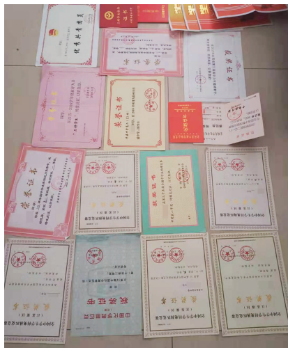
小周获得的部分荣誉证书

说到学习经验,小周坦言,自己的努力大于天赋。挤出吃饭的时间上自习,放假也留校继续学习……小周告诉现代快报记者,他还有一项特别的技能——“枯坐”好几个小时。晚自习3个小时的间隙,大部分同学会出去活动一下,小周却常常连续学3个小时。