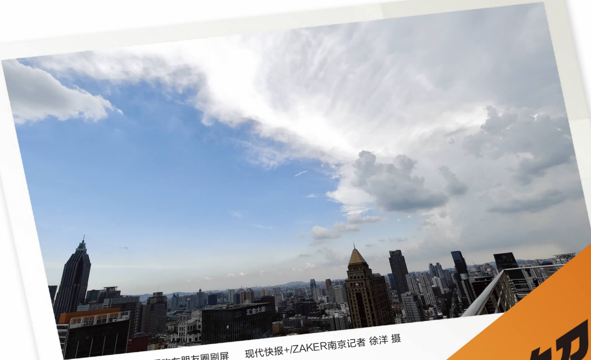
南京上空的这幅气象图昨在朋友圈刷屏