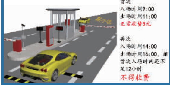
南京市物业小区临时停车收费示例

住宅小区门口一般都设置停车收费公示牌。针对临时停车,基本都设置为5元/次(1小时以上,12小时以下)。但多数车主不知道,根据《南京市机动车停放服务收费管理办法》的规定,“同一计费时段(12小时)内多次进出住宅物业管理区域的按一次计费”。