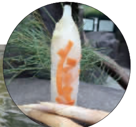
熊猫的水果冰