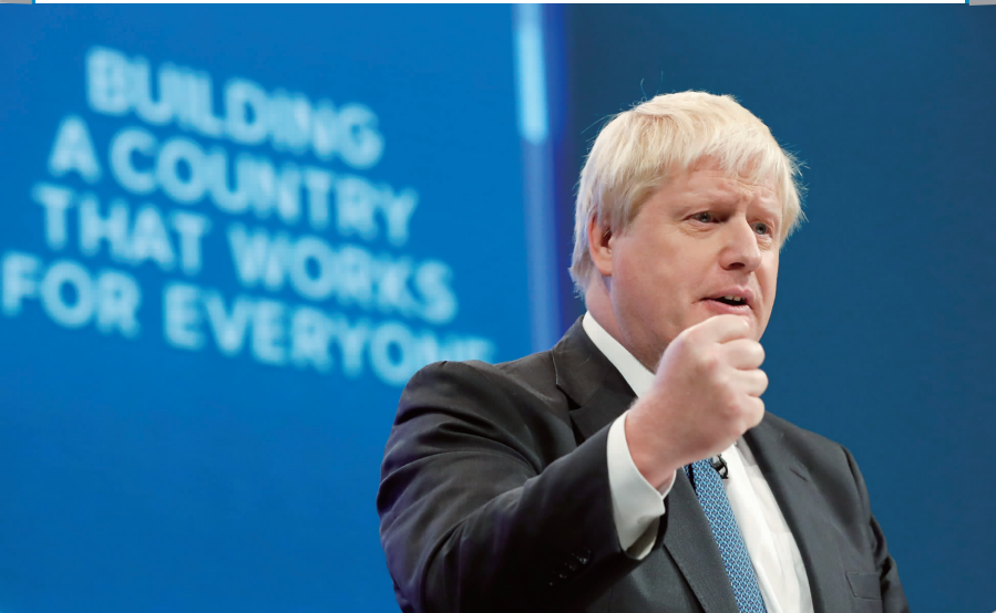
鲍里斯·约翰逊