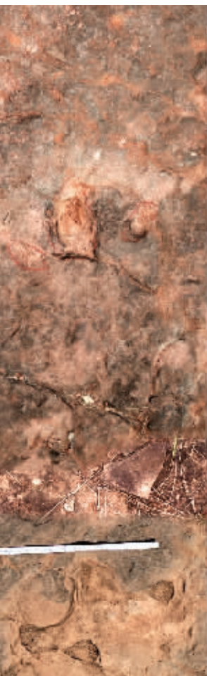
李氏滑石板三叉足迹