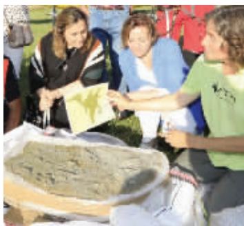
西班牙阿斯图里阿斯的足迹化石