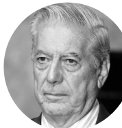
马里奥·巴尔加斯·略萨

1969年生于新疆昌吉市，18岁出版第一部小说集，1992年毕业于武汉大学中文系。现为《中国作协书记处书记》。出版长篇小说《夜晚的诺言》《白昼的喘息》《正午的供词》《中国屏风》等九部；发表中短篇小说、散文、诗歌、随笔、评论500余万字。