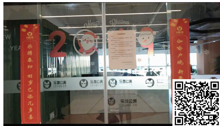
乐伽公寓大门紧闭