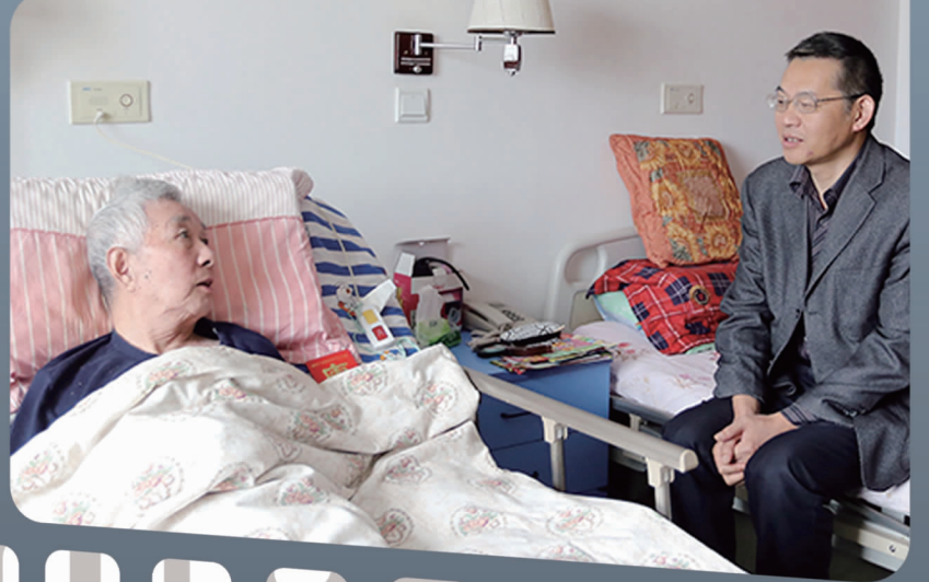
左一:老人生前照片 左二:汤老曾是2008年奥运会火炬手 左三:老人生前在病床上