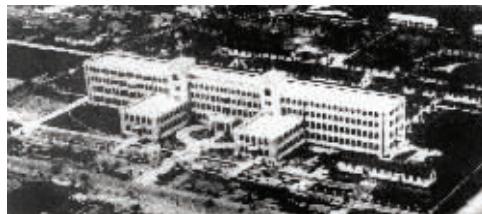
侵华日军当年在南京设立的生化武器试验基地