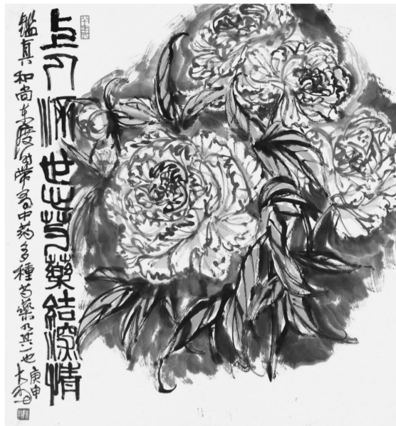
陈大羽《芍药结深情》1980年 南京书画院藏