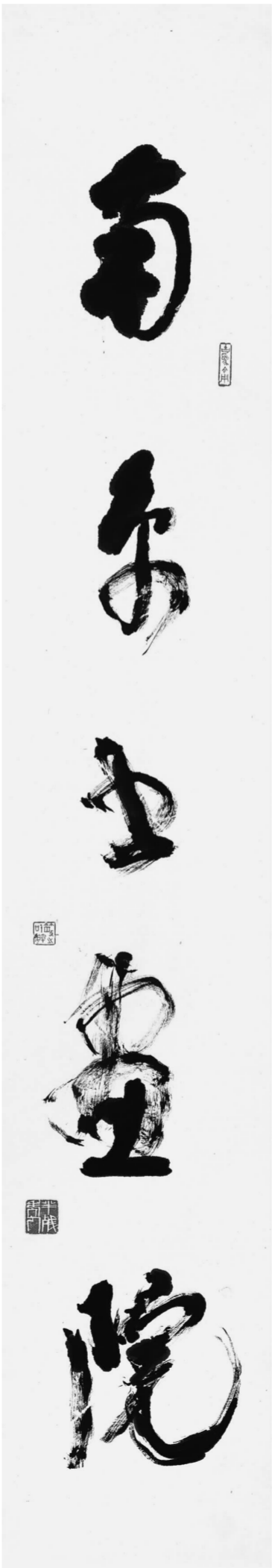
林散之《南京书画院》1979年 南京书画院藏

南京书画院就是在这个时代大背景和艺术大环境中建立发展起来的，如今以画院的规模和实力可以与江苏省国画院、南京师范大学美术学院、南京艺术学院美术学院、江苏省美术馆四大美术单位并列、并重、并行发展，他同样是包前孕后，传承金陵文脉不可或缺的书画群体。40年来书画院在南京市党和政府的领导关注下健康发展、不断壮大。首先是由德高望重的书画大师林散之和陈大羽前辈领衔创办，相继在优秀的书画家领军发展，先后在曹汶、朱道平、范扬、刘灿铭等院长带领下从事书画创作和开展社会艺术活动。画院拥有一群既有天赋又有才情的画家，他们都是在开放的新时代成长发展起来的，多毕业于南京各美术院校和公开选拔的外省优秀书画家，均受到过学院名师严谨而规范的艺术理念、画理、画法的教育及培养，这是从中西绘画传统走进现代的一代书画家。书画家们注重艺术修养和理论学习，生活中积累素材和技法经验，创作中积极探索艺术创新，作品无论从形式还是到内容，无不是匠心独具，传达了当下时代和现实生活的独立思考，呈现出作者鲜明的艺术个性，这其中不乏有在全省乃至全国享有一定知名度的书画家，被画坛所瞩目，也为南京书画院赢得了声誉和地位。