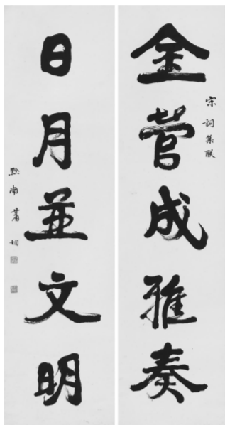
萧娴《金管日月联》20世纪80年代 南京书画院藏