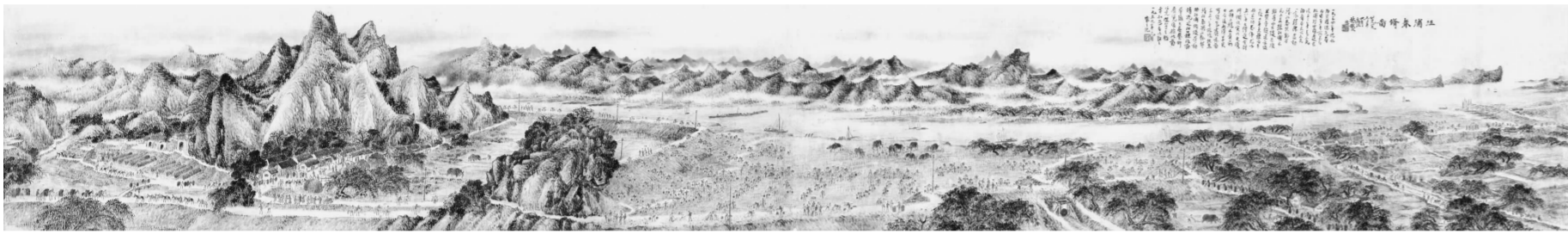
林散之《江浦春修图》1955年 求雨山文化名人纪念馆藏