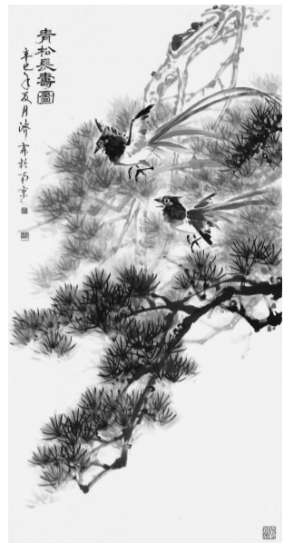
沈济霖《青松长寿图》2001年