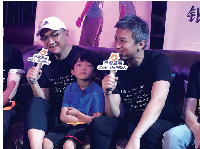
邓超(右)畅谈《银河补习班》