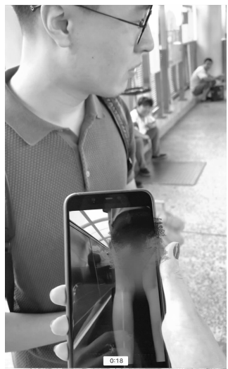
女孩发布的偷拍者

奖单注总奖金达到了213.57万元。6月22日晚新一期开奖前,大乐透奖池已达44.19亿元,敬请关注。 苏继