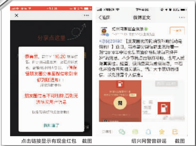
点击链接显示有现金红包 截图