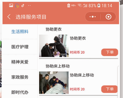
鼓楼时间银行服务项目 小程序截图