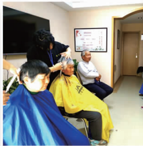
志愿者给老人理发存时间