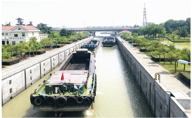
素有“苏南第一闸”美誉的谏壁船闸