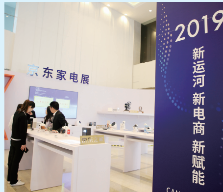
京东家电展吸引了众多年轻人的目光