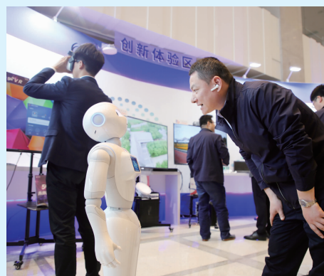
与智能机器人对话