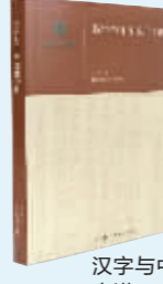
汉字与中华文化十讲