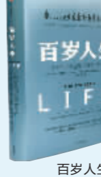
百岁人生: 长寿时代的生活和工作