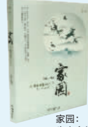
家园: 生态多样性的中国