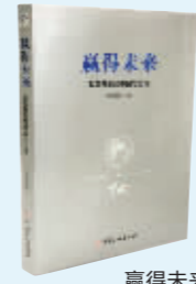
赢得未来: 改革开放的中国与世界