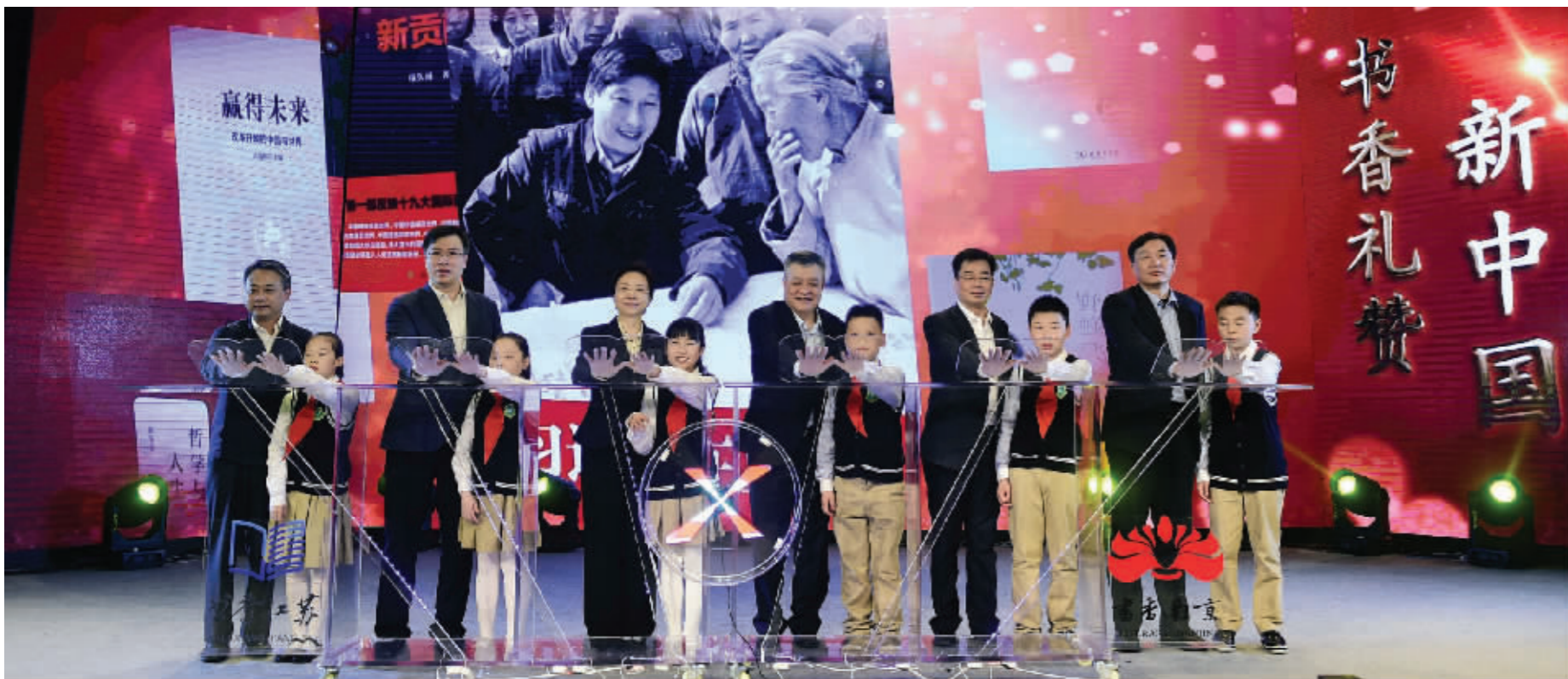
4月23日,第十五届江苏读书节暨第二十四届南京读书节启动仪式在南京举行