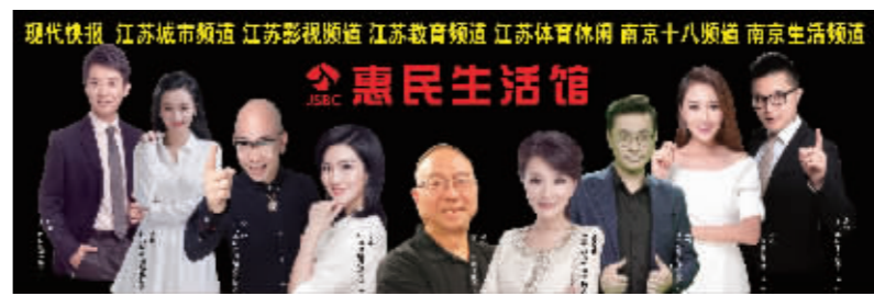
现代快报 江苏城市频道 江苏影视频道 江苏教育频道 江苏体育休闲 南京十八频道 南京生活频道

在活动现场，66岁的王爷爷一下买了5斤，他说：“现场挑选看得见，现场打粉假不了，纯三七粉，味道很纯正。抢到5折优惠名额，再买5斤送2