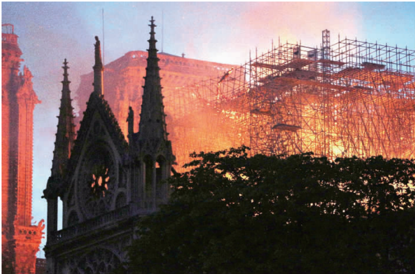
巴黎圣母院突发大火，建筑损毁严重