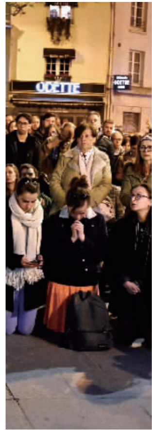
巴黎市民跪地祈祷