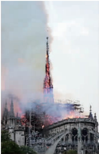
燃烧的巴黎圣母院尖塔