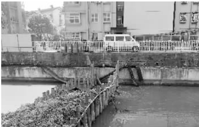
水中围堰已拆除部分