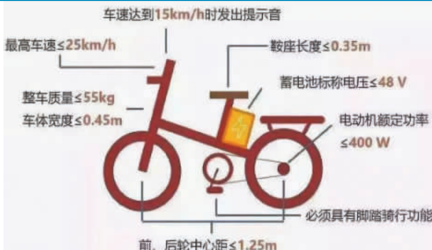
新国标电动车相关标准