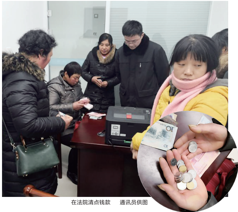
在法院清点钱款