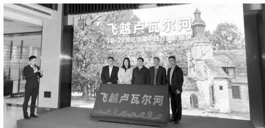
“飞越卢瓦尔河——18-20世纪馆藏中西方油彩画展”开幕

昨天下午,“飞越卢瓦尔河——18-20世纪馆藏中西方油彩画展”在上海苏宁艺术馆开幕。作为苏宁环球集团推进文化产业战略的标志性项目,苏宁艺术馆运用智慧型的展陈手段,体系化地展示中国传统艺术精品,成为苏宁环球面向公众展示的重要窗口。本次展览精选了苏宁艺术馆馆藏18至20世纪中西方油画与水彩画五十幅,以及西方名人手稿数十件,以时间为序,以地域为索,从古典到现代,打造漫步卢瓦尔河谷、沉浸法兰德斯、浣瀚华夏大地的飞越地图。展览将持续至6月23日。