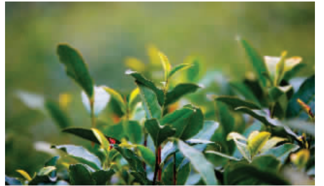
中山陵茶厂的茶树