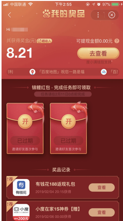
现代快报记者实测,除夕抢到的8.21元百度红包,可以正常提现