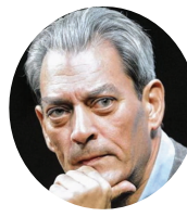
保罗·奥斯特 (Paul Auster)

1969年生于新疆昌吉市，18岁出版第一部小说集，1992年毕业于武汉大学中文系。现为鲁迅文学院副院长。出版长篇小说《夜晚的诺言》《白昼的喘息》《正午的供词》《中国屏风》等九部；发表有中短篇小说、散文、诗歌、随笔、评论500余万字。