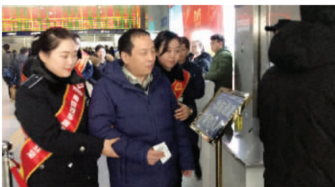
车站工作人员搀扶盲人旅客上车

目前,南京南站地区的互助互帮的换乘方式已经拓展成全南京市由地铁、高铁、长途汽车、公交、出租、社会车辆六种交通出行