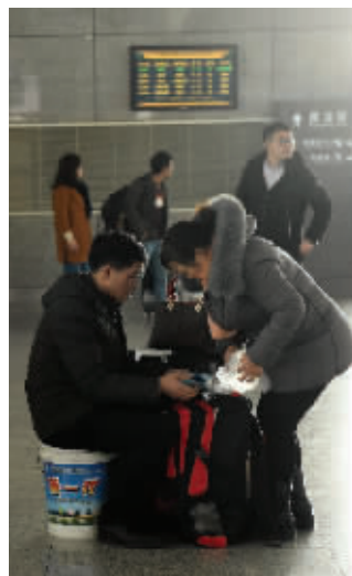
这个桶还是候车神器