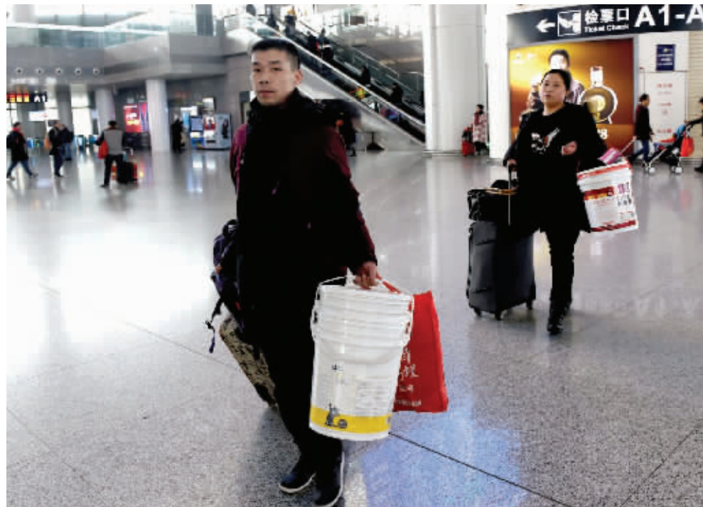
春运首日,在南京南站,不少旅客一手拖着行李箱,一手拎着涂料桶