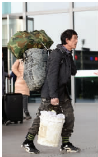
别看桶小,能装不少零碎东西