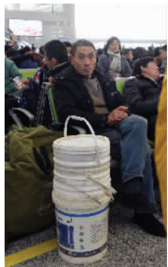
这位大叔,带了一堆桶回家