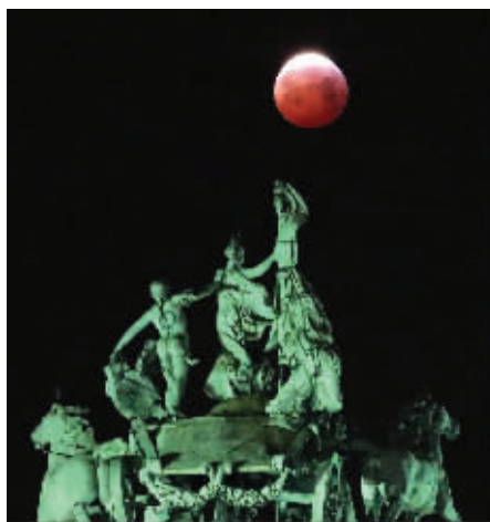
当地时间1月21日,比利时布鲁塞尔 超级红月亮

21日不仅有“超级月亮”,还有精彩的“月全食”。天文预报显示,本次月全食始于北京时间21日12时41分,结束于13时43分,持续1小时2分。遗憾的是,这时正值我国白天。据了解,我国公众上一次目睹“红月亮”是在2018年7月28日,下次再见要等到2021年5月26日。