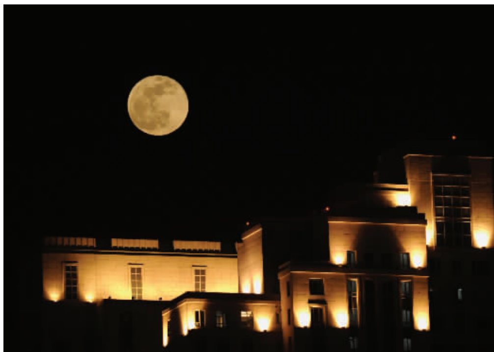
1月21日,大连,天空中的“超级月亮”