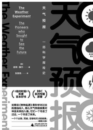
《天气预报》 [英]彼得·穆尔 广西师范大学出版社 2019年1月